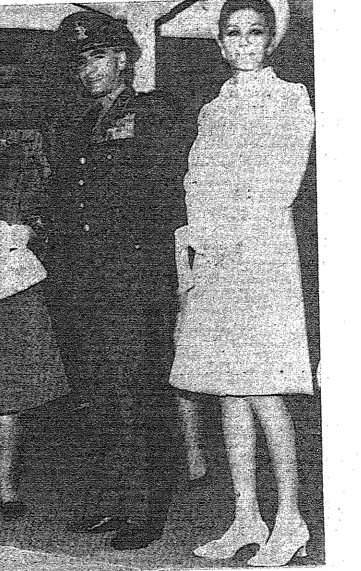
جلالة شاه ايران والاميرة فرح ديبا في استقبال الرئيس اليوغوسلافي يتو وزوجته لدى زيارتهما لطهران

لندن - رويتر - ترك حوالي عشرة الاف من عمال البناء احتجاجهم ومظاهروا أمام البرلمان احتجاجاً على هجرة بلونيت لبريطانيا. ونظف العمل في ميناء لندن تقريباً وتوقف تحميل وتفريغ عشرات السفن. وشق العمال طريقهم في جماعات الى مجلس العموم ووقفوا في صفوف ضمت اصحاباً يضع مئات أمام المبنى. وسبح البوليس لجماعات تآلف كل منها من ١٢ رجلاً يدخل المبنى واحدة بعد الاخرى للاحتجاج الى النواب. ورفع العمال لافتات تؤيد المستر افوك باول العضو الميميني في حزب المحافظين الذي طرد من قيادة الحزب لاقباله خطباً عنصرياً اعتبر مشراً. وقالت لافتات حملها المظاهرون «اغلقوا الباب قبل ان يغلق الوقت» و «اتكلروا ثبوت انقذوا»